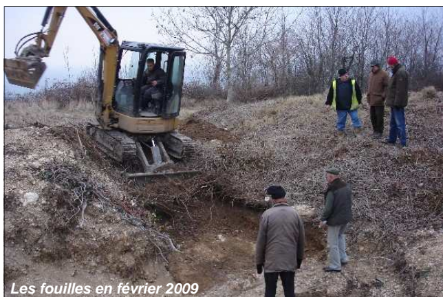
Les fouilles en février 2009

Indice non négligeable: une traverse et ses sabots de fixation de rails, en bon état, à 90° de l'ensemble précédent, et qui correspondait bien au plan d'origine. D'où une seconde fouille « mécanique » qui s'avancera en direction du chemin du garage, dont la forme et le niveau actuels ont quelque peu évolué depuis la fin de la guerre et qui ne figurent sur aucun des plans. On se heurtera, après avoir mis à jour trois autres traverses